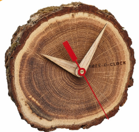
Tischmodell (Art. 60.1028.08)