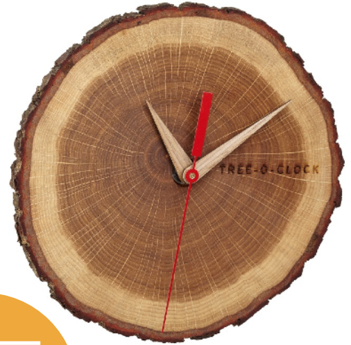
Wandmodell (Art. 60.3046.08)